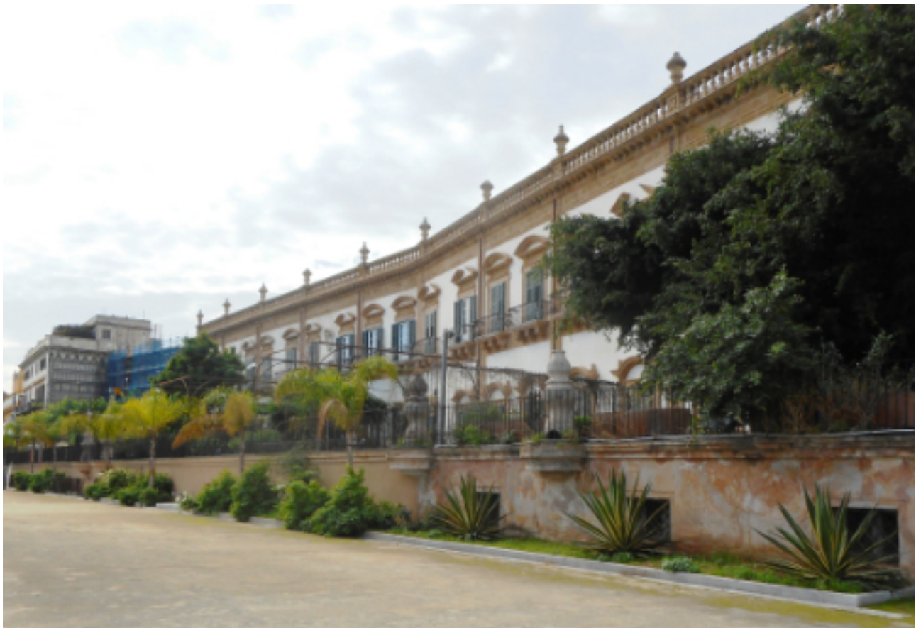
Le palazzo Butera à Palerme.