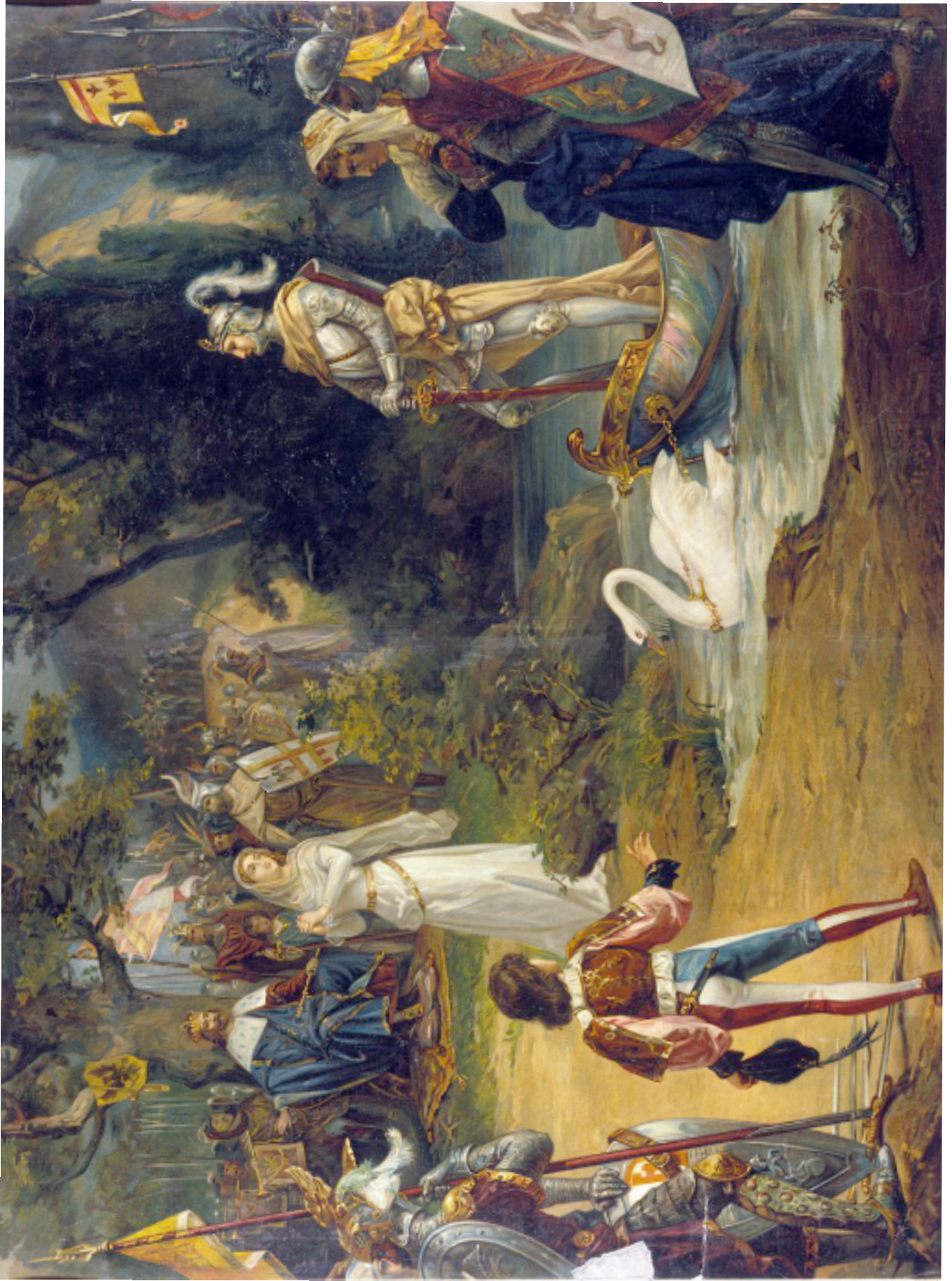
Anonyme : Arrivée de Lohengrin à l'acte I (XIX e siècle).