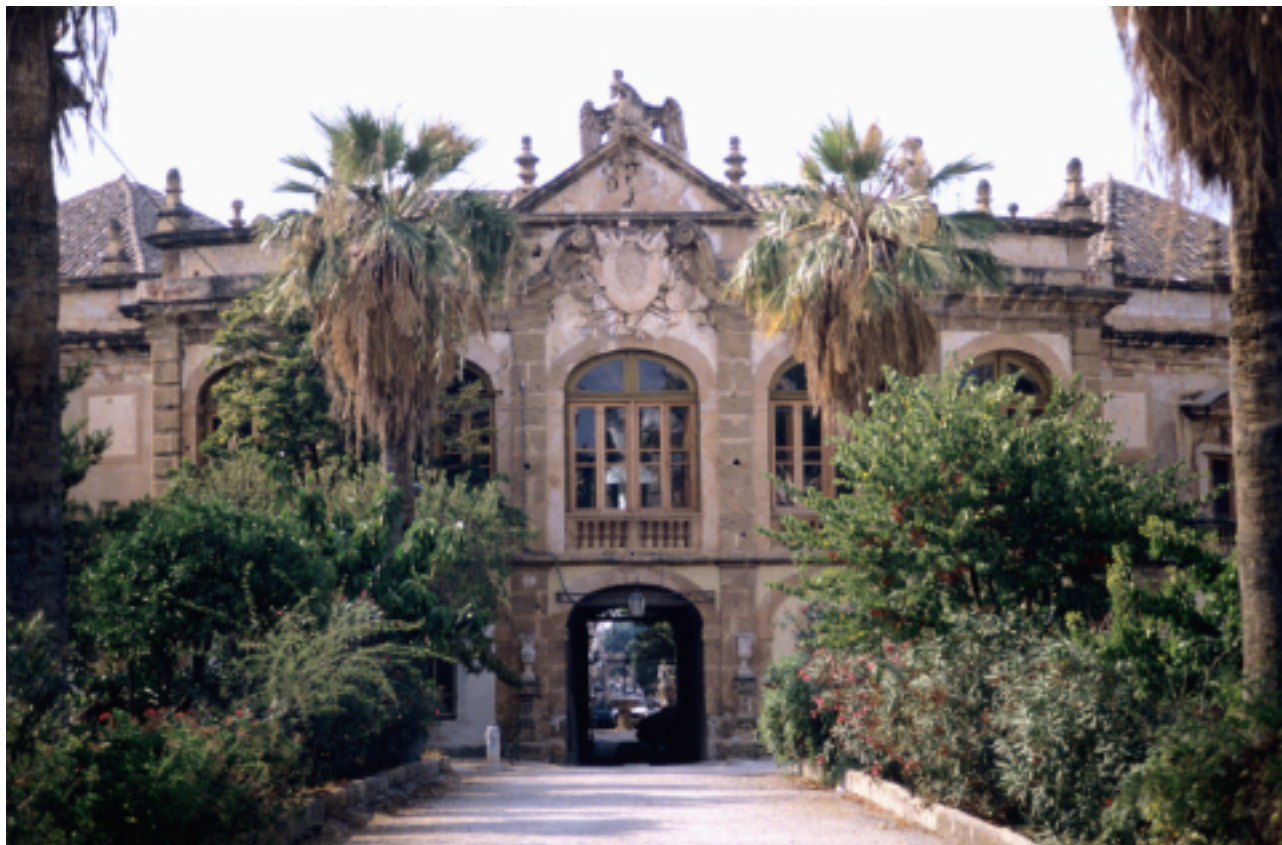
« Nous sommes rentrés d'une très belle excursion à la campagne (Bagheria). La façade de la Villa Palagonia à Baghiera.