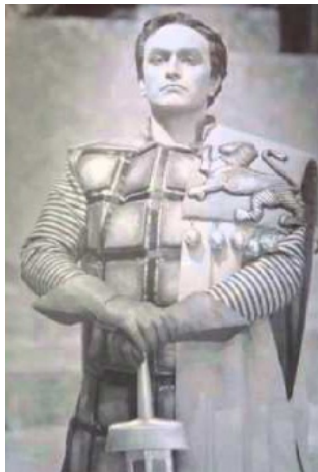
Ernest Blanc en Telramund à Bayreuth en 1958.