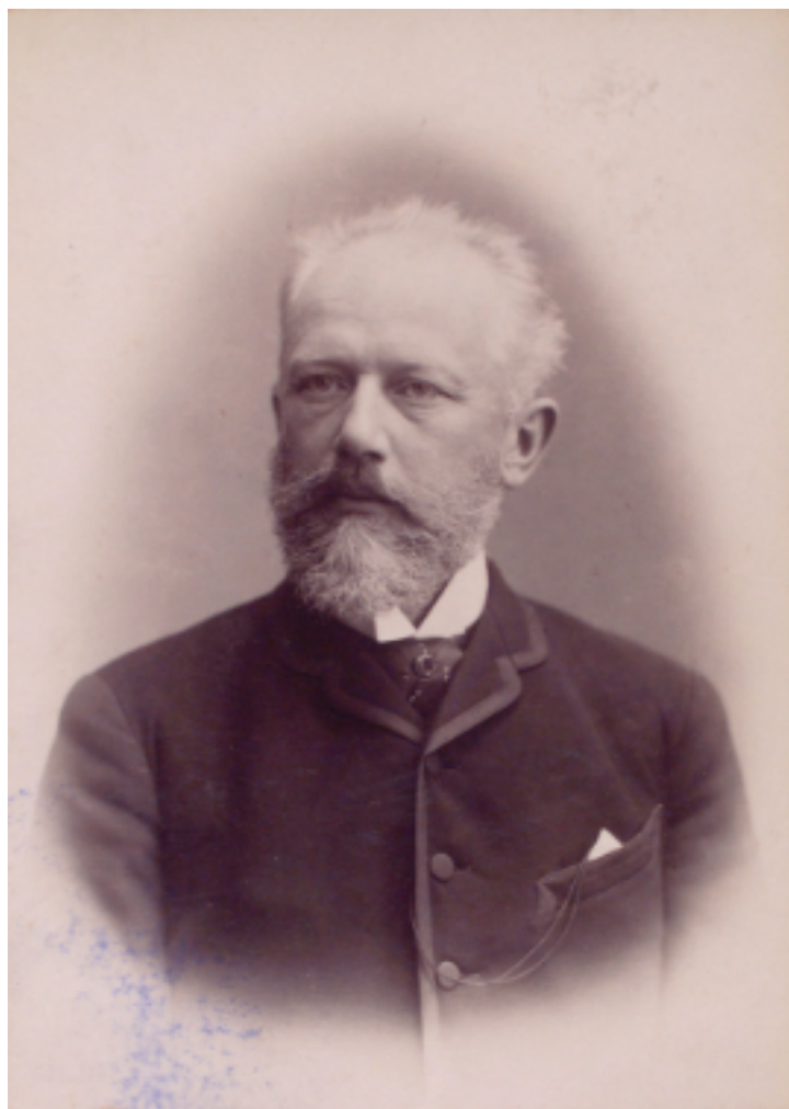
Tchaïkovski en 1888.

Je trouve assez intéressant pour les lecteurs des « Nouvelles russes » ( Russkiye Vedomosti ) de retracer toutes les péripéties aussi bien des préparatifs du festival musical de Bayreuth que de la représentation elle-même de l'œuvre monumentale. Le soussigné s'est déjà assuré une place pour le prochain festival et entend rapporter dans les pages de ce journal à la fois les impressions qui l'attendent et les détails de tout ce qu'il se passera à Bayreuth au mois d'août prochain. Mais afin que le lecteur comprenne très clairement l'importance de l'œuvre de Wagner, et pour ne pas revenir par la suite sur les circonstances qui accompagnèrent la réalisation de cette entreprise artistique audacieuse, j'ai l'intention dans la courte étude présente de raconter l'histoire de la naissance du théâtre de Bayreuth, destiné à présenter au monde musical la plus immense et la plus complexe