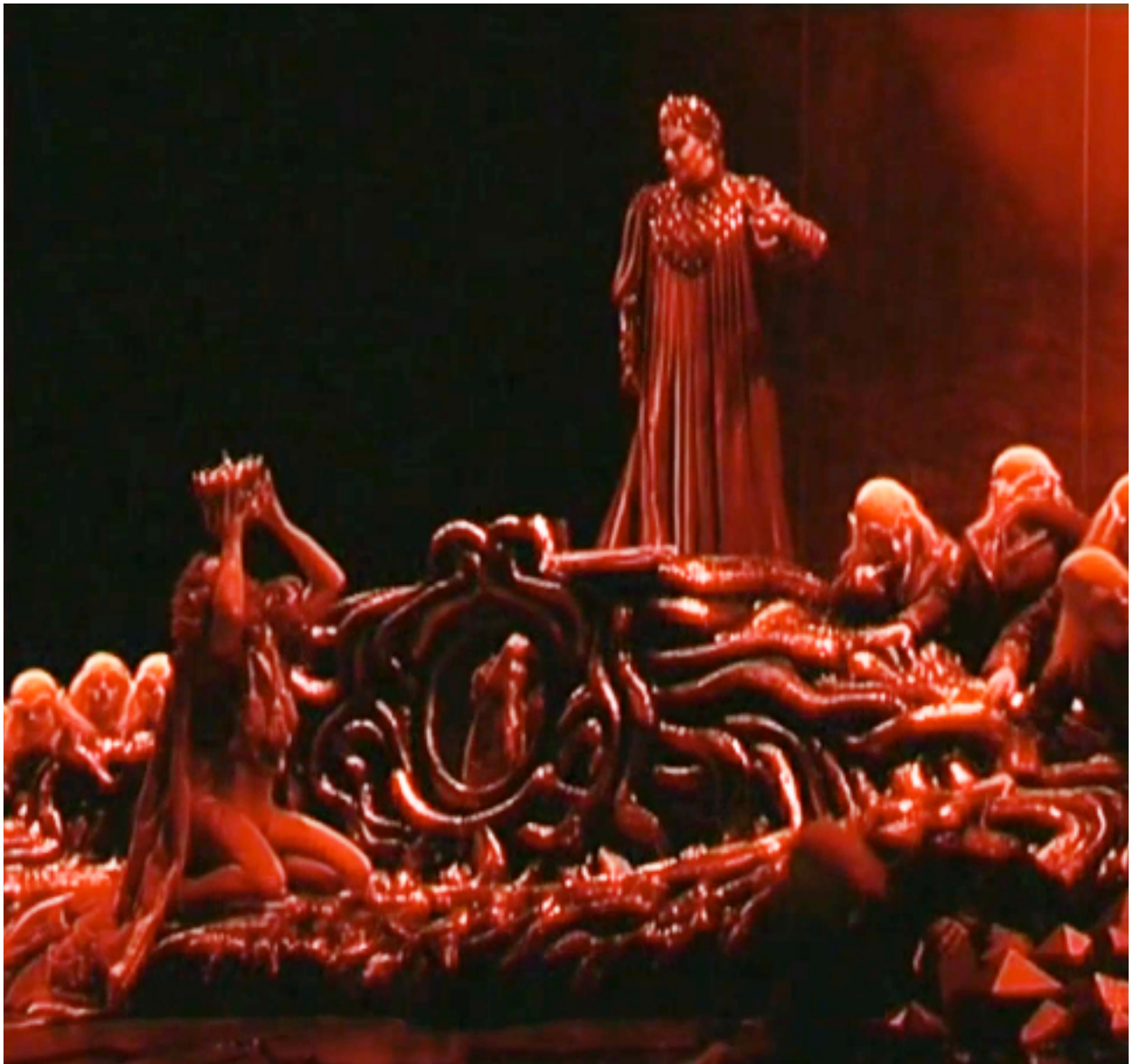
Hans Heiling d'August Marschner, prologue. Mise en scène de Pier Luigi Pizzi à Cagliari en 2005.