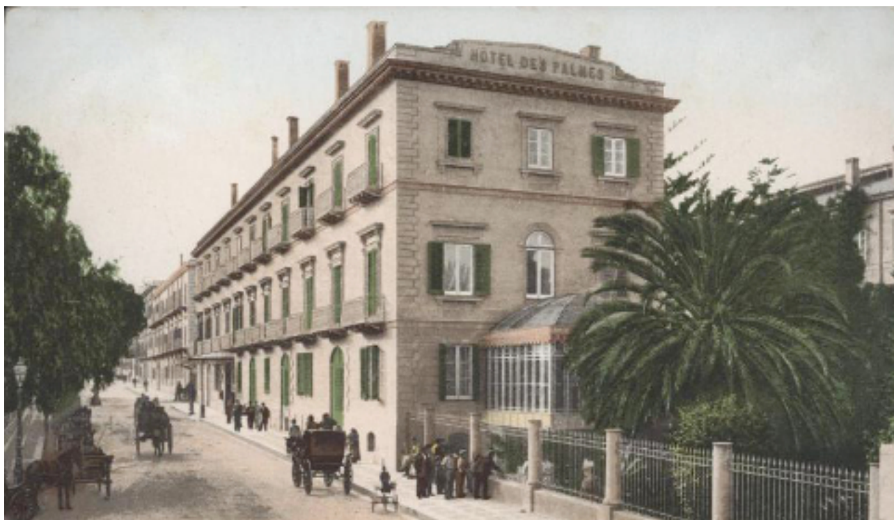
Le Grand Hôtel des Palmes de Palerme, où résidaient les Wagner. (Carte postale ancienne.)