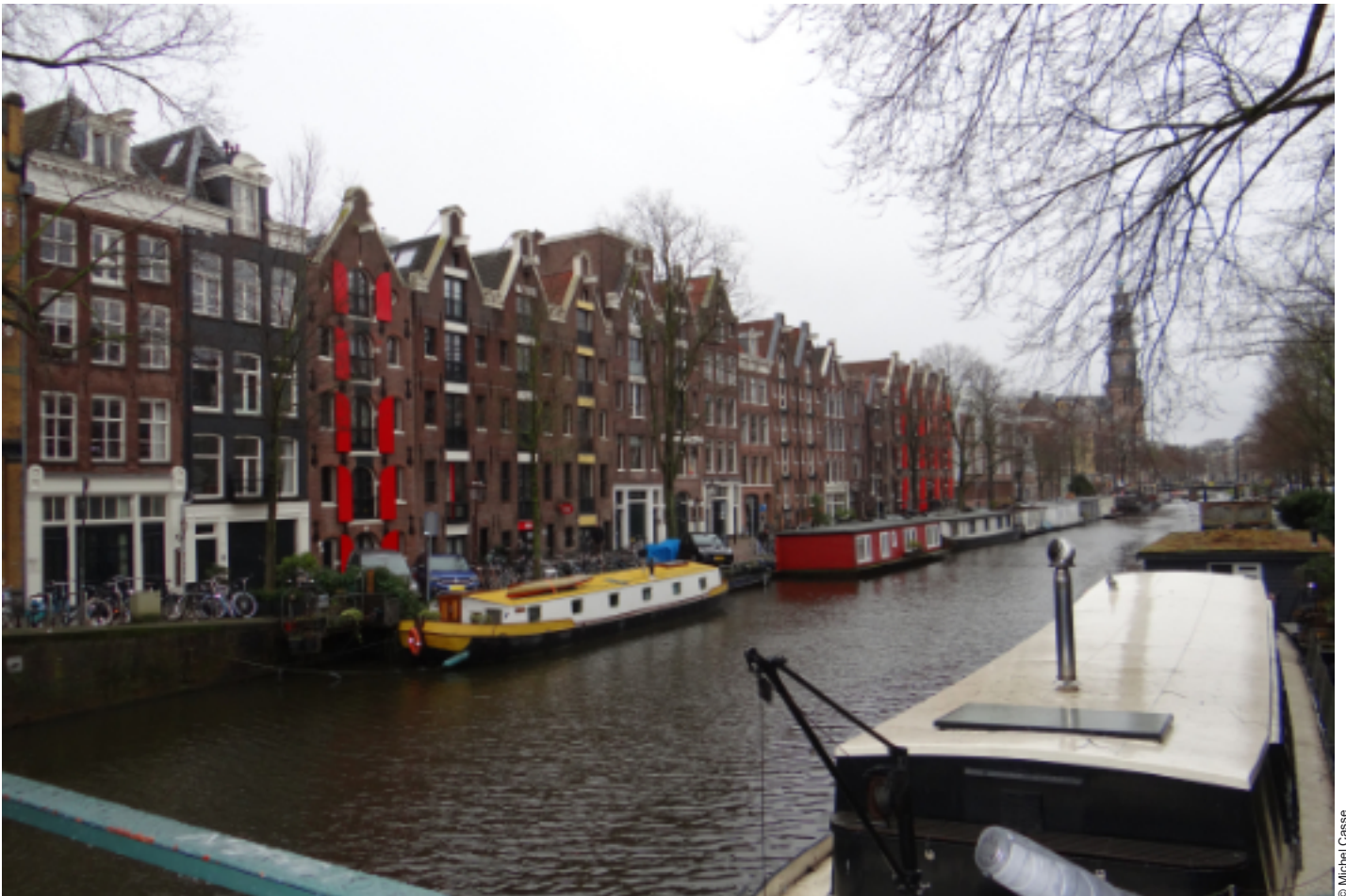
Amsterdam. Au hasard des rues et des canaux...