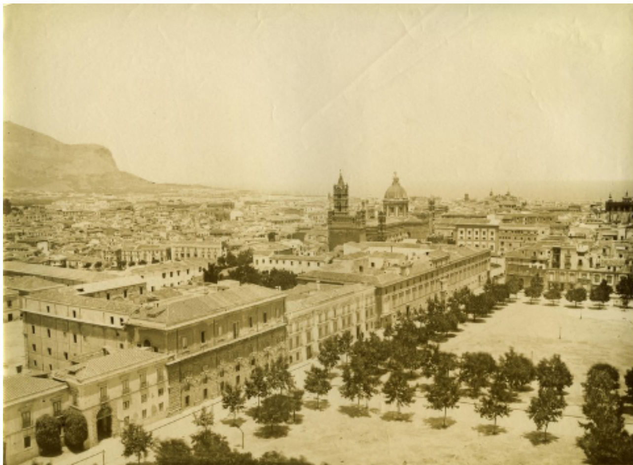
Palerme : panorama depuis la Porta Nuova (années 1880).