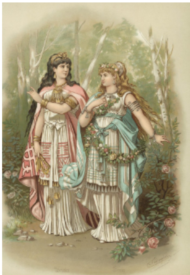
Fricka et Freya.

Trois sortes d'êtres différentes luttent entre elles pour la possession du monde ; les dieux, les géants et les nains. Dans le monde lumineux des dieux