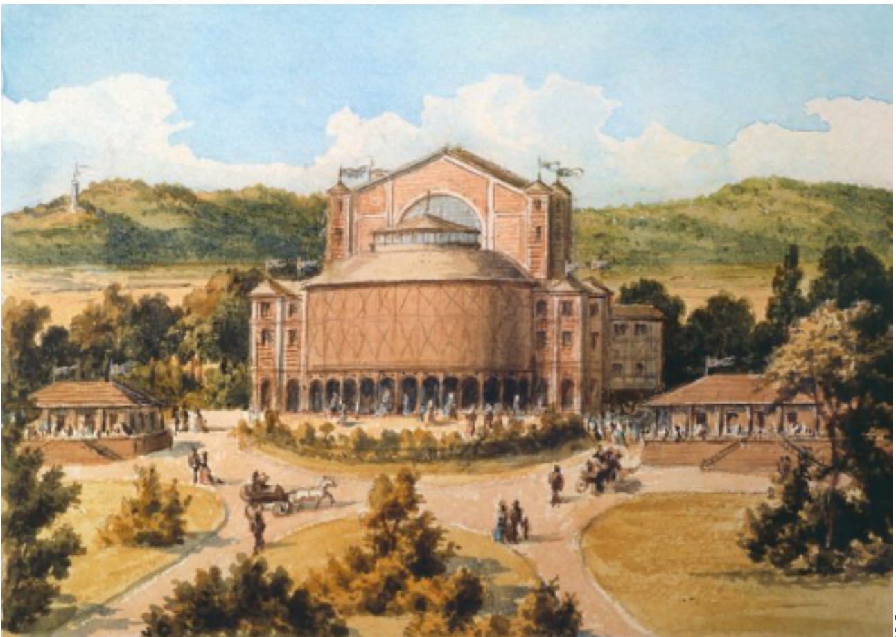
Le palais des festivals de Bayreuth en 1876.

Ses amis vinrent à l'aide de Wagner, qui cherchait les moyens de réaliser ses vastes projets. L'épouse du ministre prussien Schleinitz et le pianiste Karl Tausig, décédé il y a cinq ans, tous deux admirateurs enthousiastes du compositeur, conçurent un plan fort ingénieux pour procurer à Wagner le nécessaire pour la construction d'un théâtre temporaire avec tous les dispositifs, la somme de 30 000 thalers, grâce à l'organisation de sociétés par actions de 300 thalers chacune. La mort empêcha Tausig d'être le fondateur de ces sociétés, mais sa pensée ne demeura pas stérile. À Mannheim, plusieurs admirateurs de la musique de Wagner, constituèrent, selon la pensée de Tausig, une société qui reçut le nom de « Société Richard Wagner » (Richard-Wagners-Verein). L'exemple de Mannheim trouva rapidement des imitateurs ; tout d'abord à Vienne, puis dans différentes villes d'Allemagne, ensuite également en dehors des frontières de la patrie du compositeur, à Pest, Bruxelles, Londres et New York, où des sociétés similaires virent le jour les unes après les autres. Au début de 1871, les espoirs de Wagner étaient déjà si proches de se réaliser, qu'il commença à chercher dans quelle ville il serait conviendrait le mieux de construire son théâtre.