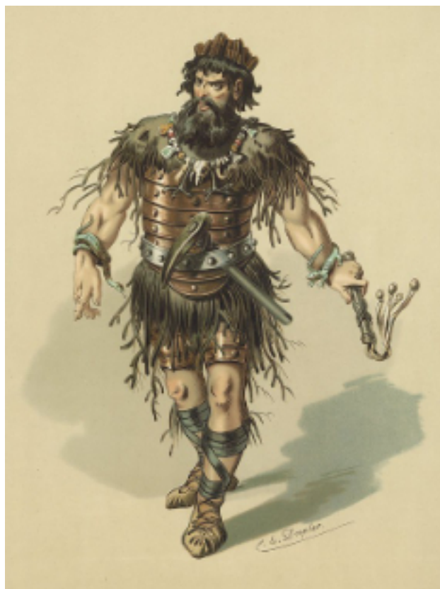
Alberich, maître des Nibelungs. Dessin de Carl Doepler, pour les costumes du premier festival de Bayreuth.