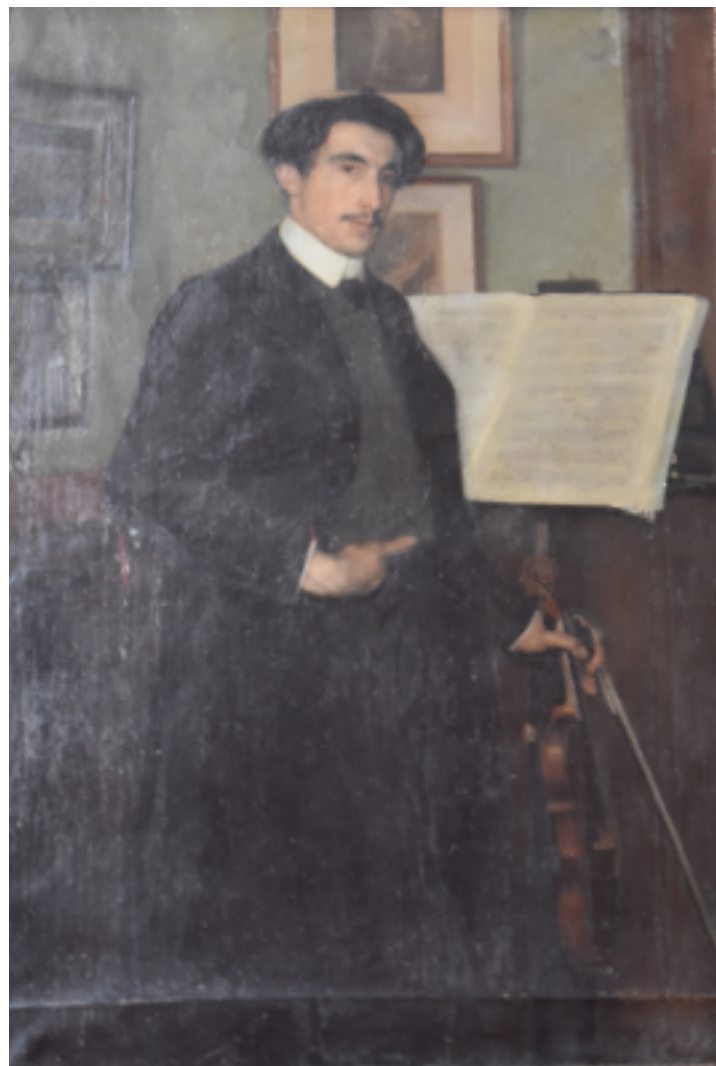
Raoul Laparra en 1905.