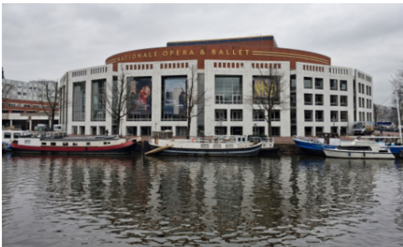
Souvenir d'Amsterdam : le Nationale Opera & Ballet (pour d'autres souvenirs du congrès, voir page 36).