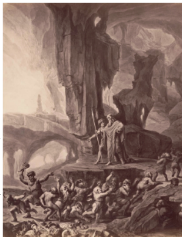
L'Or du Rhin, scène 3.

Dessin de Josef Hoffmann pour les décors.